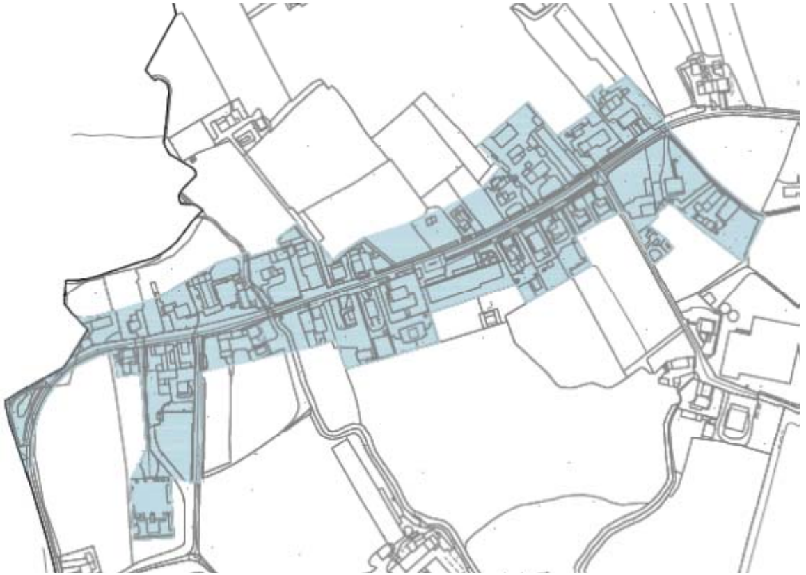
Frazione di CARTURO