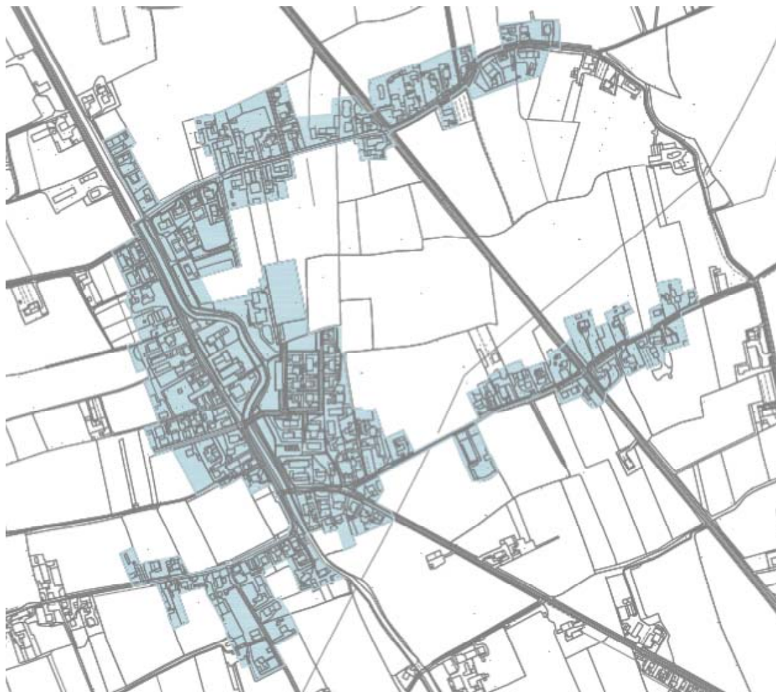
Frazione di PRESINA