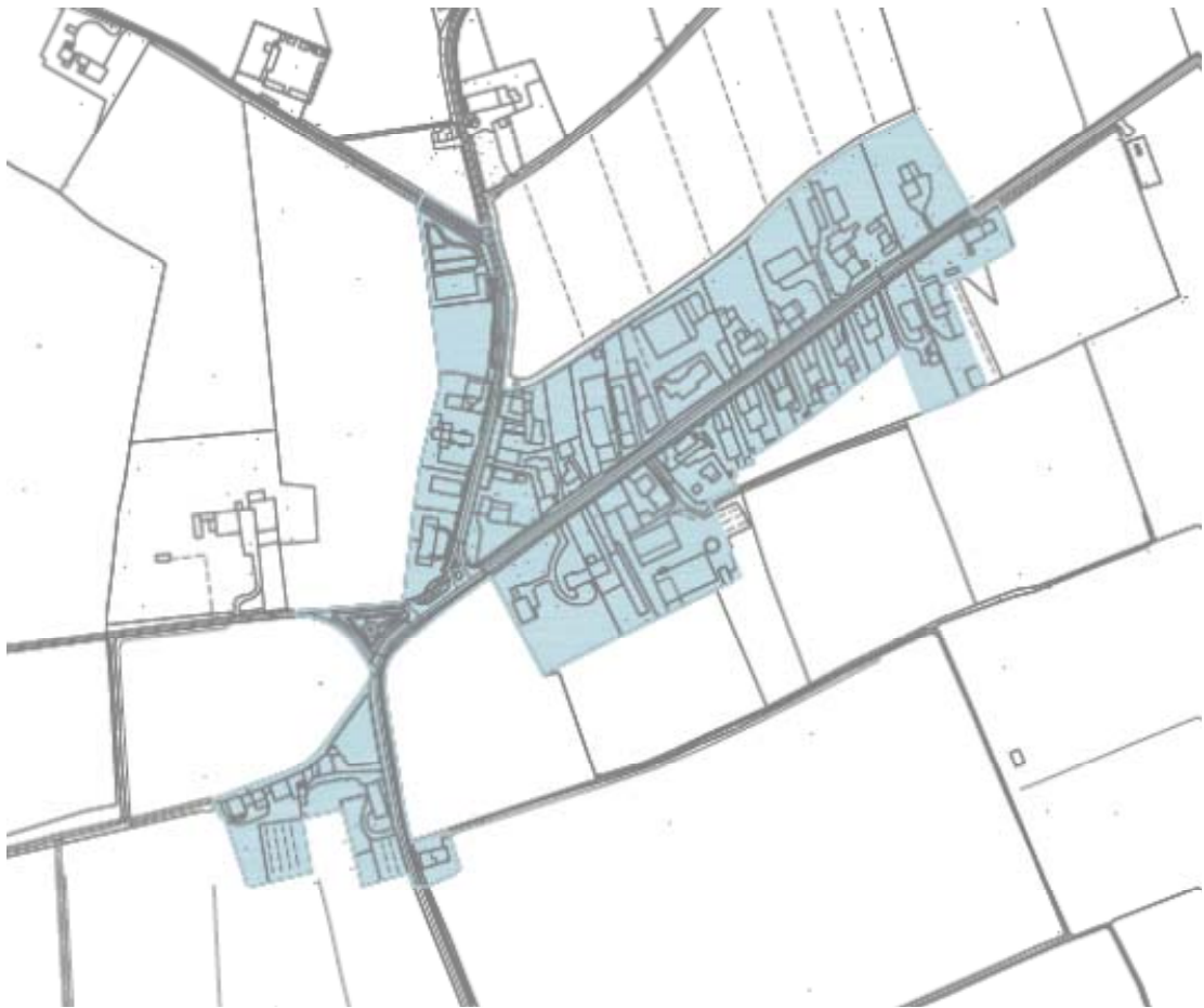
Frazione di ISOLA MANTEGNA